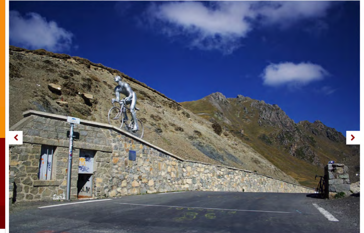
© The Col du Tourmalet was part of the 2014 Etape du Tour (pic: muneaki / Creative Commons)