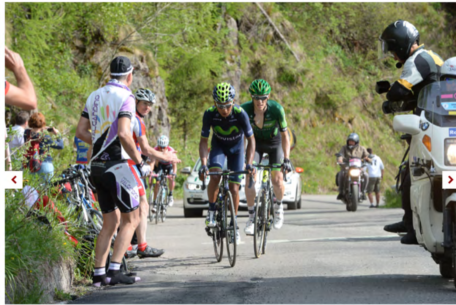
© Nairo Quintana and Pierre Rolland tackle the Montecampione at last year's Giro d'Italia (pic: Sirotti)