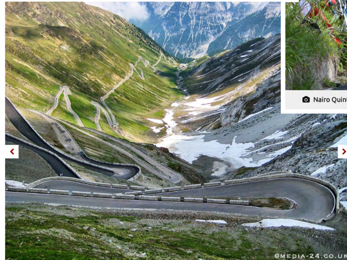
© The iconic Passo dello Stelvio is likely to feature on the 'must ride' list of any cyclist. pic: ©Media24