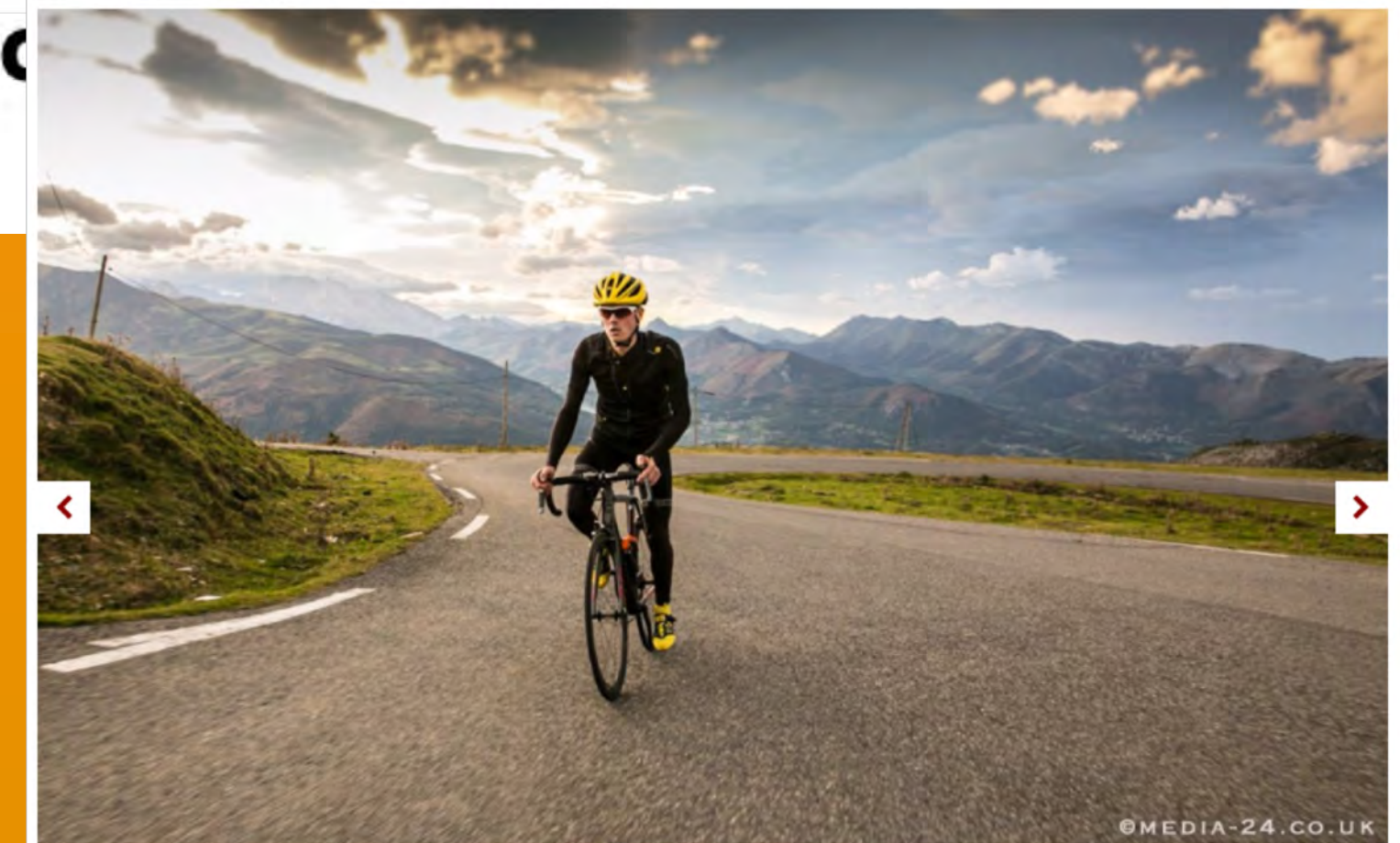
© The Hautacam has become a popular modern addition to the Tour de France pic: ©Media24