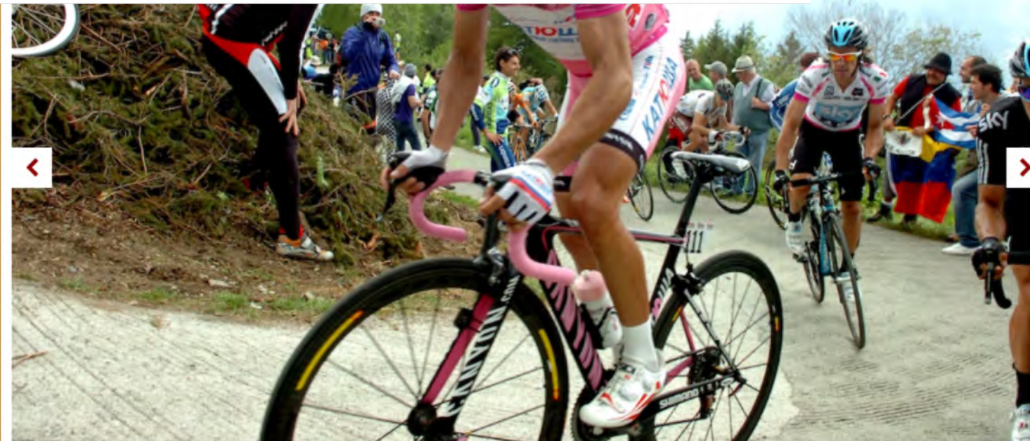
© Joaquim Rodriguez resplendent in the maglia rosa at the 2012 Giro d'Italia, tackles the Mortirolo